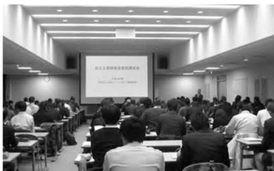
自主工事検査員等登録講習会の様子