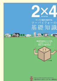
「ツーバイフォーの基礎知識」

● さまざまな用途で採用されているツーバイフォー工法による施設系建築の事例を紹介したガイドブック