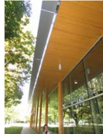
13) 庇 CLT