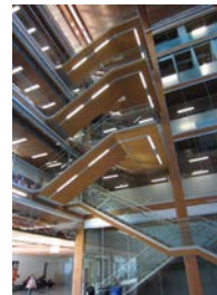
14) 階段 CLT