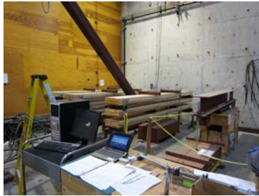
5) CLTのクリープ試験法を定めるための試験