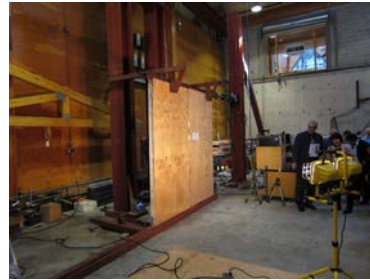
6) 壁耐力試験：ねじを使用、解体時の容易性から検討している