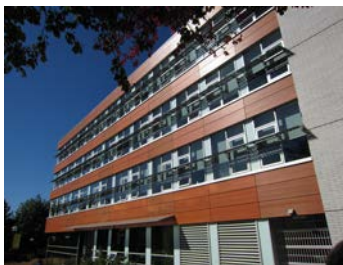
7) 外観：窓上はソーラーパネル

学生数5万人を有するカナダでは2番目に大きい大学構内にある施設。Post&Beam 構法で、床にはランバーを縦使いで使用している。ソーラーパネル、雨水利用などサステイナブルな要素技術を取り入れている。