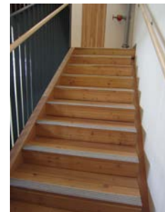
9) 非常階段ランバー表し