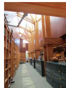
4) F P イノベーションズ 図書室 パララムが美しい

カナダ全土に研究施設を有する民間の研究機関。築23年の研究施設の紹介とカナダにおける木造に関連する最新情報の発表が行われた。