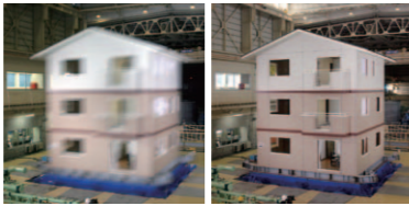
平成18年の3階建実大三次元振動台実験