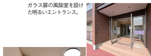
ガラス扉の風除室を設けた明るいエントランス。