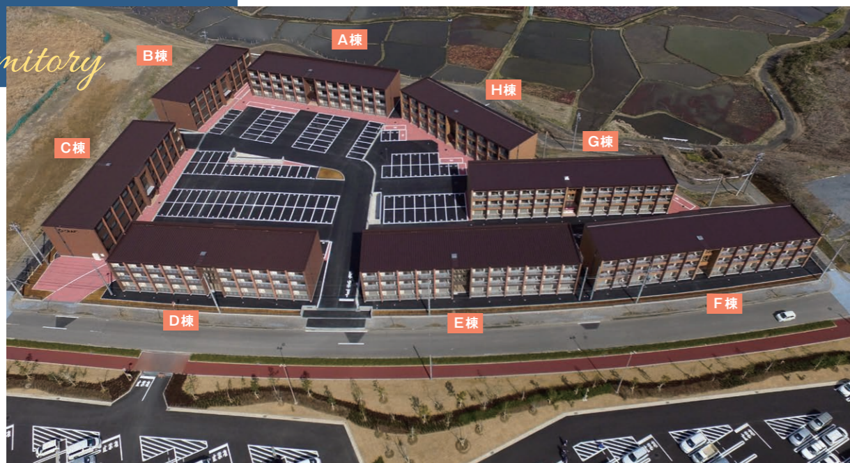
病院の隣接地に建設された寮。A～E棟が看護師職員寮で、F～H棟が看護師専門学生寮である。建物を敷地境界側に寄せ、中央部に駐車場を配したゾーニングは、女性の住人が多くなることを考慮し、死角をつくらない防犯性と、採光・通風、プライバシーの確保という快適性を重視した設計による。