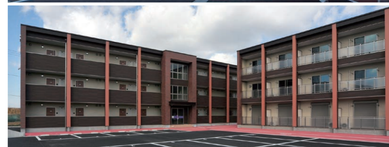
全棟ともツーバイフォー工法の3階建て(準耐火建築物)。外観は周辺環境に溶け込み、街の品位を高めるデザイン。窓に断熱サッシ+遮熱・高断熱複層ガラスを採用している。1階には防犯性を考慮してシャッターを設置している。