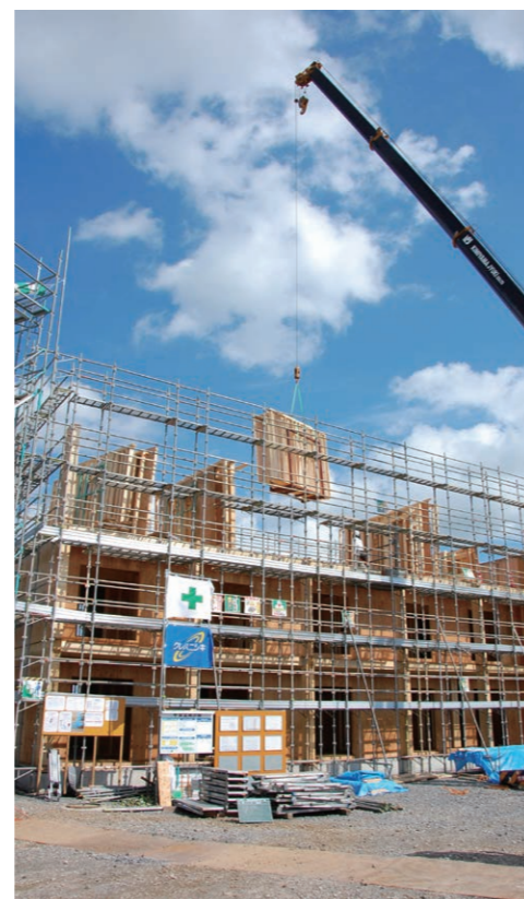
大量のパネルは、生産能力が国内最大級の工場をもつ資材会社が製作に当たった。8棟の寮建設に協力した建設会社は4社。各社の総力が結集され、6カ月という短工期を実現した。

寮は看護師の勤務体制が3交代のため、遮音対策として、界壁はグラスウールと石膏ボードの二重張りに、上下階(界床)は吊天構造で吸音効果を高める仕様とし、生活音の低減もはかっている。また、ツーバイフォー工法の耐久性も評価されたことから、長期に賃借する方式が受け入れられている。