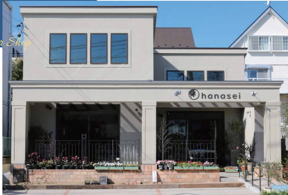
41年地域で親しまれてきた生花店が、ツーバイフォー工法で建て替えられた。ファサードに以前の面影を残し、レンガ、アイアンフェンス等も再利用されている。向かって左側が店舗の入り口、右側が半戸外空間の中庭となっている。