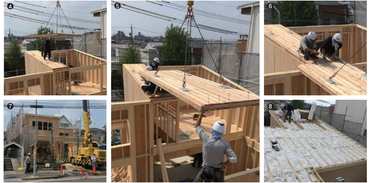
④⑤⑥ CLTパネル(杉材・4層120mm)の施工の様子。「CLTは精度が高いためスピーディに作業が進んだ」とコンポーネント会社の担当者は語る。 ⑦ CLTパネルの施工後の外観。 ⑧ 屋根は省エネ性能を高めるため、CLTパネルの上に208材の垂木を敷いて断熱材を施している。

①② 店内は吹抜けの傾斜天井がCLTのあらわしになっている。天井高は最大約6mある。ロフトがつくれ、収納スペースとして利用されている。壁面には明るいグリーン色が採用されている。 ③ 親しみやすいショップになるように、中庭を取り込んだオープン設計になっている。