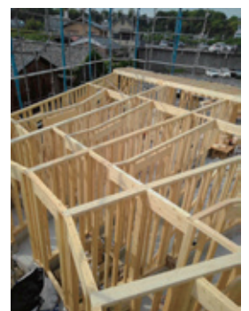
扇形に区画を設けた構造体