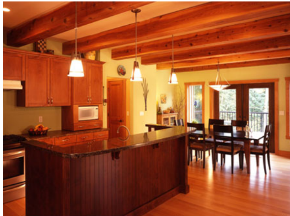
▲キッチンとダイニング

この家は、木材関係の仕事に従事するオーナーが、コストダウンを図るため自らプロジェクトマネジメントをして建てたものである。間取りは一般的なものではあるが、室内外にふんだんに木が使われ、周辺に建つローコストなカナディアンハウスとは一線を画している。外壁にはウエスタンレッドシダーのサイディングを採用。ツーバイフォー住宅ではあるが、リビングは節もあらわな重量感のある化粧梁がポスト&ビーム（軸組構造）を思わせる佇まい。玄関ポーチのデザインも相まって、全体に木の香あふれる山荘のような雰囲気を感じ出している。照明に浮かび上がる夜の外観は特に美しさが際立ち、道を行く人にも温かさが伝わるようだ。