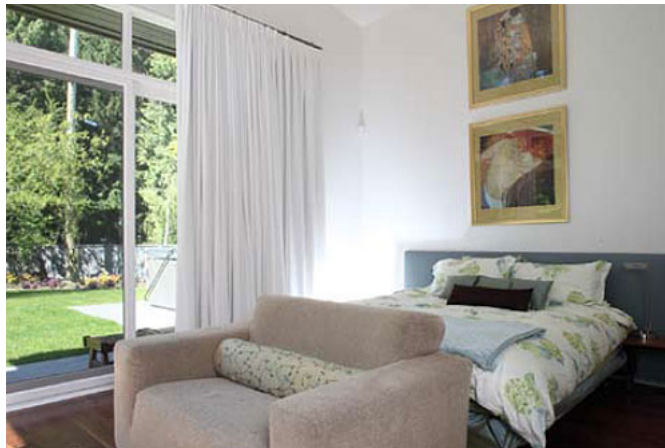
▲マスターベッドルーム