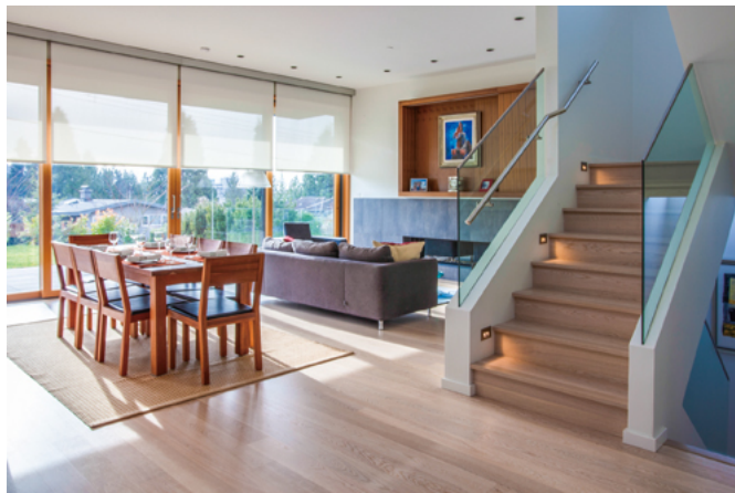
社交の場のダイニングとリビング。木製の食卓と布製のソファがなごみを演出。