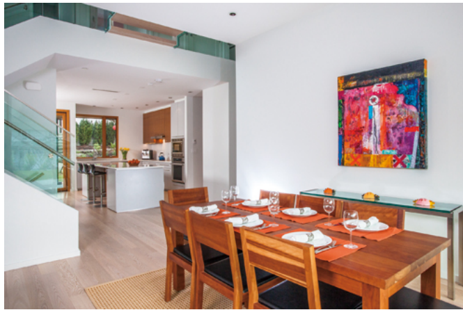
手前は南棟の社交の場、奥は北棟の家族のDK。間は吹き抜けになっている。