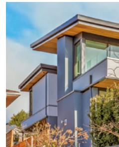
手前の南棟は片流れ、奥の北棟は陸屋根。

ウエストバンクーバー市の住宅街に建つ戸建て住宅です。南側道路に面する敷地の広さは660m 2 。南北に長く、北側に向かって高く上がっている立地を生かして地階を設けました。現在は多目的空間として使用されていますが、将来、賃貸スペースに転用可能です。外部との出入口やサニタリー設備を設置し、キッチンに利用できるカウンターにはシンクが装備されています。