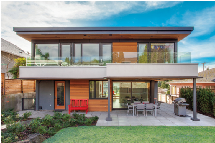
北側外観。2階の大きなバルコニーが屋根となったテラスはアウトドアダイニング。