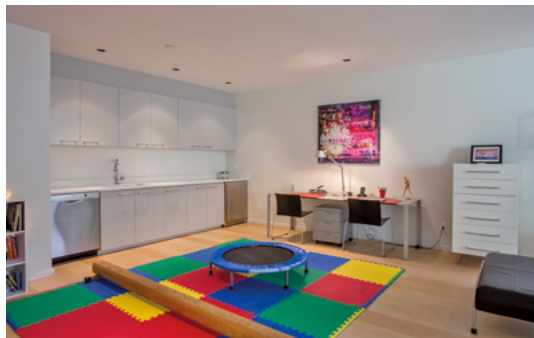
地階の多目的室。賃貸スペースへの転用を想定し、カウンターにシンクを設置。