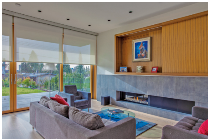
シャープなデザインの暖炉が設置された社交の場。南側のテラスとつなげて使える。