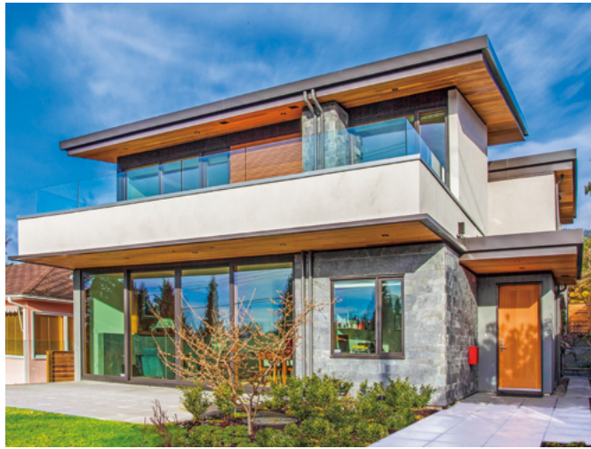
木材、スタッコ、石（御影石）、ガラスなどの建材が調和する親しみやすい南側外観。