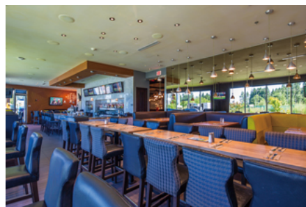
1階のレストラン。奥にはバーカウンターが設置されている。