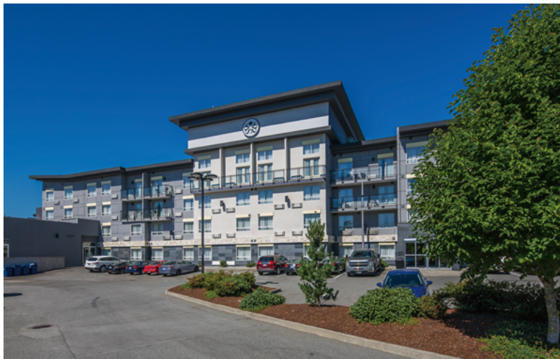
東側も西側と同様の外観デザインで、中央の4階部分が吹抜けのスイートルームである。