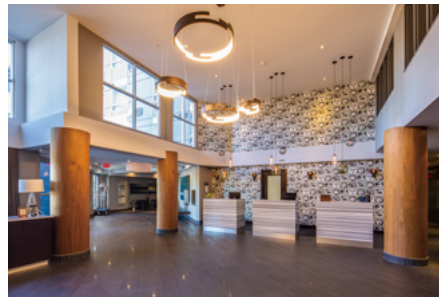
玄関を入ると広いロビーがある。ホテル全体はツーバイフォー工法だが、この空間は木骨構造による。フロントの壁面には「集い」を象徴するたくさんさんの顔がデザインされている。