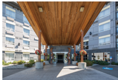
正面玄関に設けられた木造のキャノピーの大きさは幅8m×奥行14.7m。屋根には赤杉の木材が使われている。

館内施設にはレストランやバー、宴会場、ビジネス会議場に加え、フィットネスセンターや屋内プールも併設され、非日常を楽しめる空間が提供されています。