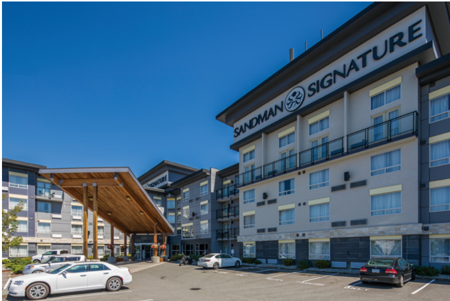
カナダ産木材が使われた木造4階建てのホテル。西側に正面玄関が設けられている。駐車場はT字形の建物を囲むように配置されている。

正面玄関の木造の大きなキャノピーが印象的な「サンドマン シグニチャー ホテル」は、ツーバイフォー工法による4階建ての木造建築（一部木骨構造）です。OSBとLVLの複合材である軽くて剛性の高い部材（TJIジョイスト）が使われ、大地震にも耐えられる構造になっています。