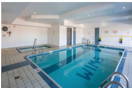
1階にある屋内プールとジャグジー設備。 さまざまなジムマシンが置かれたフィットネスセンターもある。