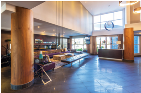
吹抜けのロビーの奥には、落ち着いた趣のラウンジコーナーがある。