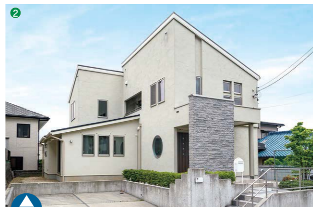
増築部分(左手前)にはなだらかな傾斜屋根が採用され、既存の外観デザインとの調和が図られた。左側の空きスペースには、将来ウッドデッキがつけられる予定。