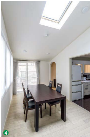
4 増築されたダイニングは勾配天井の伸びやかな空間。トップライトが設置され、隣接するリビングも明るい空間になった。

くつろぎ、食事をする、勉強をする、遊ぶ場所が明確になり、おもちゃが散らかっていたリビングが整然と保てるようになった。