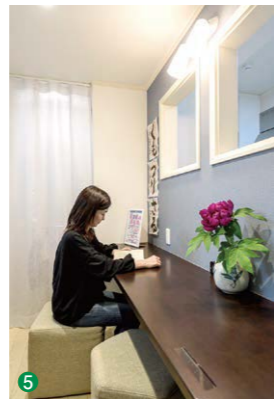
5 スタディールームではおさんの勉強をみながら大人も読書等を楽しめる。上部の開口がキッチンとつながる室内窓である。