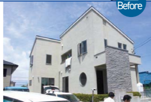
南東から見たリフォーム前の外観。

キッチンを囲むようにダイニングとスタディールームが増築された。スタディールームにはデスクと本棚が造り付けられ、カーテンの奥はクローク。アーチの入口はお子さんのお気に入りだという。