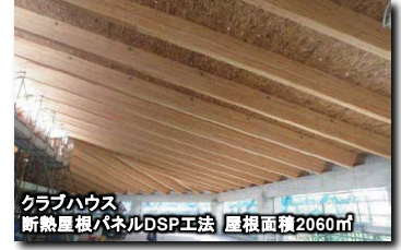
クラブハウス 断熱屋根パネルDSP工法 屋根面積2060㎡