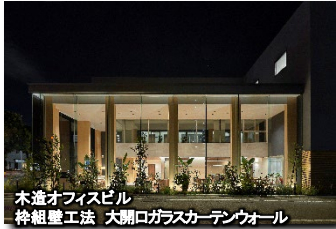
木造オフィスビル 枠組壁工法 大開口ガラスカーテンウォール