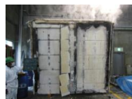
2時間耐火構造 性能試験