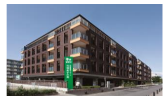
ツーバイフォー5階建て(1階RC)、 9,000㎡超の高齢者施設(東京都)