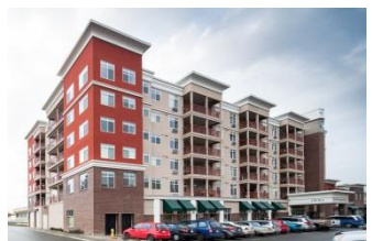
カナダのツーバイフォー6階建て www.naturallywood.com